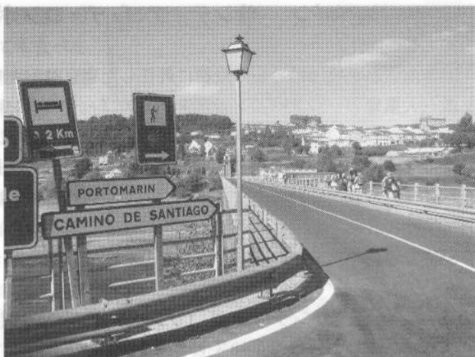
第一日目の巡礼宿まであと一息

歩きかためられたサンティアゴへの道、時には現代の道と並走したり交差したりしたところはあるが、その多くは中世の人々の生活を想像できるような昔のままの道だった。朝霧の中にたたずむ石造りの家、草をはむ牛や馬、石畳の道を多くの巡礼者達が黙々と歩く。ヨーロッパ各地やブラジルはじめ南米の国々、アジアは韓国が一番多かった。歩きの早い人、遅い人、しかしお互いすれちがう時「ボン・カミーノ」と声をかわす。