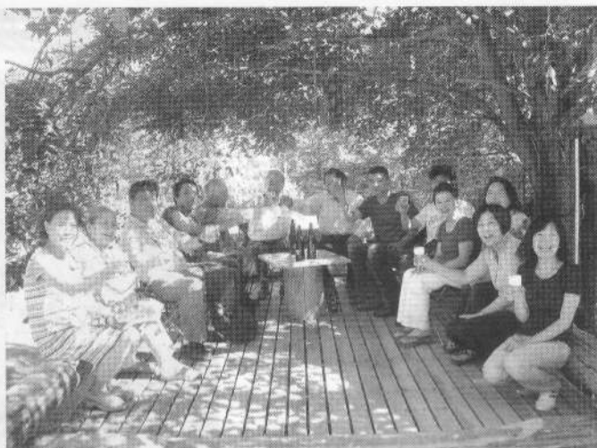
新しくできたウッド・デッキ、小枝が自然の屋根。

ック、一頭があぶらむの敷地の中へ、「おーい、そっちじゃないぞー」と叫んでいる私。大豆は野ウサギ、タヌキ、イノシシにやられ、その他の野菜も野生動物のためにつくっているようなものとなってきた。今年はドングリもまったくできず山にエサとなるものが少ない受難年。町の有線放送はクマ出没の案内ばかり。あぶらむの里への出没もイノシシ同様時間の問題か。それにしてもあんなに沢山実っていた柿の実がアツという間に