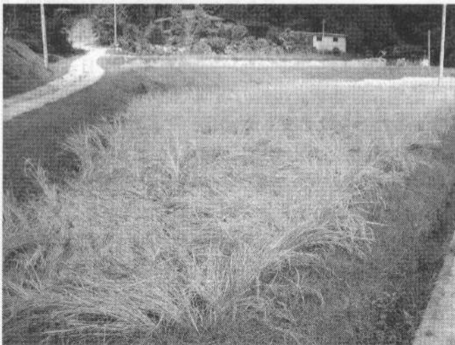
猪に踏み荒らされた近所の田。収穫は放棄された。

刈り入れ間近の田がイノシシに踏み荒らされた田ほど無惨でみじめなものはない。山に近い田畑は電線をはって自衛につとめているが莫大な費用がかかる。今年も近くの前がやられていた。あぶらむの里も3～4年ほど前より山手の方に出現している痕跡はあった。ミミズをねらって土を掘りくりからかすのである。それがだんだんと下の方におりてきた。警戒心の強いイノシシ、用心に用心を重ねながら少しずつ安全を確認、下の方へおりてくる