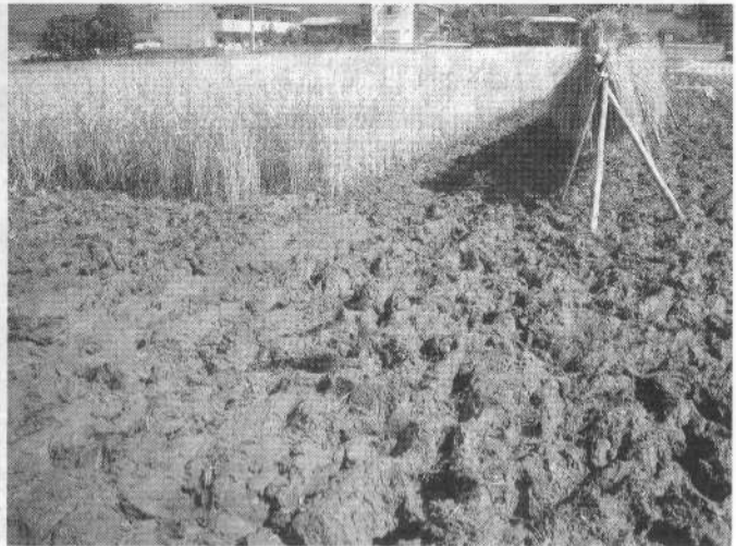
いつまでも乾かない田、まるでカベ土のようだった。

足が沈んで抜けなくなるため足場板を敷き、その上に乗って刈り取るあり様だった。また、稲刈り時は乾いていなくても、脱穀時には軽トラックが田に入るほど乾くはずなのに、今年はキャタピラをはいた脱穀機でさえ沈んでしまうあり様だった。そしてそこで大ハブニング、脱穀機が火事になってしまったのだ。タイヤならいざしらずキャタピラものまでが沈んでしまう状況に対して、脱穀と同時に細かく切断するワラを田に敷き、