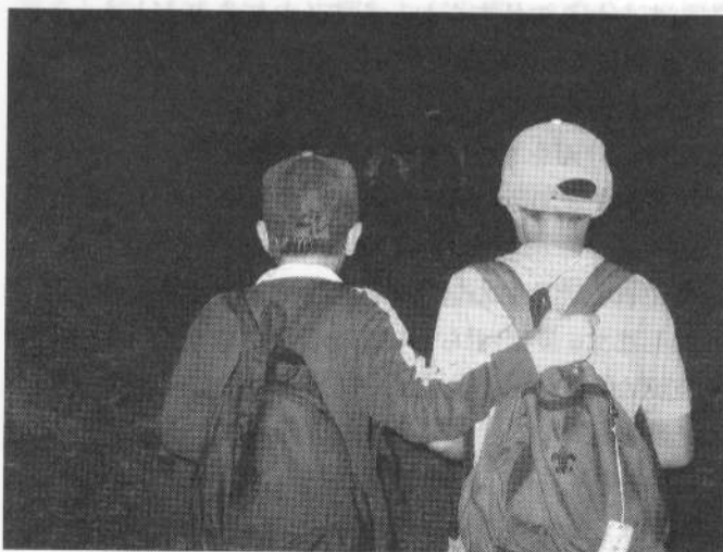
暗くても仲間がいれば大丈夫

一回り大きく成長します。暗闇の中、仲間とともに26キロを歩き切った経験は、この先辛いことや大変なことがあった時にも、きっと子どもたちの中で、一つの拠り所になってくれることでしょう。また、あぶらむの生活の中では、「危険」との付き合い方も学びます。現代の私たちの生活は、とにかく危険なことを遠ざけることばかりを考えがちですが、あぶらむは「危険だからと言ってそれを避けていては、いつまでも危険と向き合う