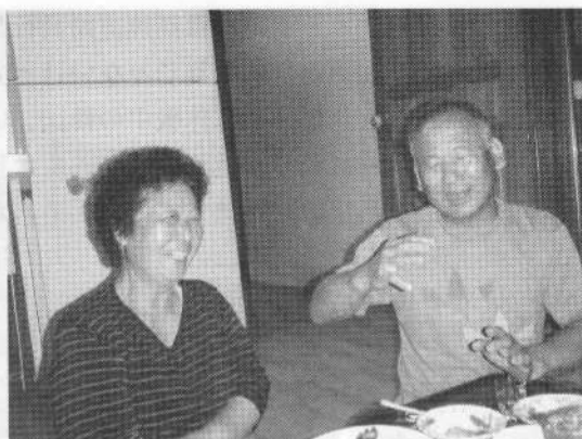
よっばらいの草の根交流、韓日大歌合戦

夜はオーさんのなじみの民宿で、漁師から直接買った大ゴコを食べる。食べても食べてもタコ。韓国の人はどうして単品物を沢山食べるのだろうか不思議に思った。私はお礼に持参していたラッパのマウスピースで「リアン」を吹いた。その家のオヤジさん大感激、焼酎の勢いも加わり、その夜は韓日大歌合戦となった。こんな草の根のよっばらい交流もいいものと思った。