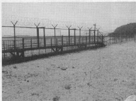
300km余も続いていた鉄条網

総走行距離3478km、韓国内走行距離2090km、風を感じ、温度を感じ、ニオイを感じ、一つ一つ道を探し求めながら韓国の人々の生活の一部面を肌で触れる鉄馬の旅だった。