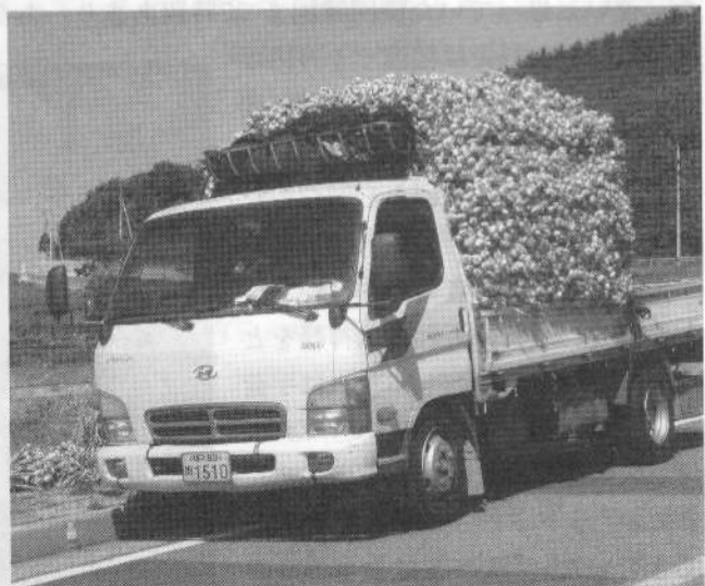
ニンニクの収穫期、トラックに元気満載。