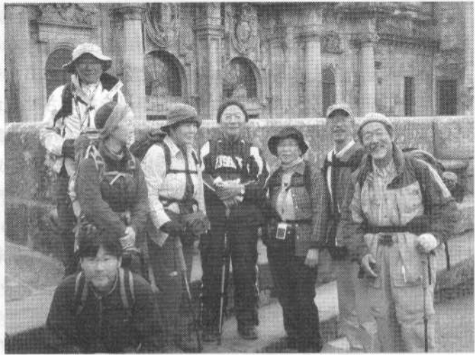
聖ヤコブの眠るサンティアゴ・デ・コンポステーラに到着した参加者一行

6日目最終日、遙かかなたに聖ヤコブが眠る教会の尖塔が見えるため、長い巡礼の旅をしてきた人々は互いに手を取りあって喜んだという“歓喜の丘”、そのゴソーの丘から路面に埋め込まれたサンティアゴへの道標“ホタテ貝”をたよりに古い街並みを4.5km歩くとサンティアゴ・デ・コンポステーラだ。途中で声を交わすようになった一人巡礼のドイツのご婦人は泣きながら周囲の人々と抱きあっていた。1200kmを歩いてきたという。ご主人を亡くされたの