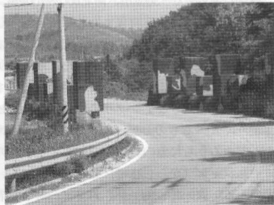
38度線近く、道路封鎖用の巨大ブロック