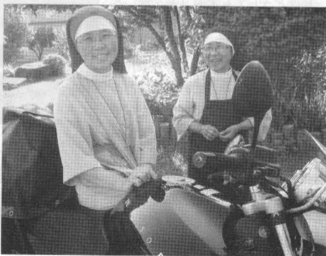
シスター、お似合いですヨ。

宮崎県での口蹄疫真最中ということもあり、車輛の汚れには神経をとがらせていた。オートバイ組は手荷物検査など厳しいときいていたが、何と入国審査室に私たちを出迎えに来ていたシスター（修道女）が入ってきていた。「この人は日本のシブニー（牧師さんだよ）」という一