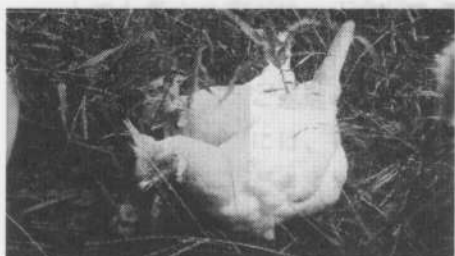
ももちゃんとはなちゃん

色が見られるのがとてもうれしい。車の中にはいつも花バサミを入れてあって、買い物の途中でも草むらに珍しい花があるとそれを頂戴して、宿に飾るんです。それがとても楽しいのね。宿には買った花は似合わないし。