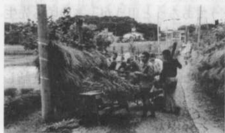
学院生徒達の稲刈り風景

たデンマークは、今度こそ、自由で社会福祉国家をめざすのである。義務教育は9年間であり日本と同じであるが、その中身はかなり異なっている。私が驚かされたのは、たとえば英語のリーダーの教科書（デンマークの母国語はデンマーク語）を読ませる時には、生徒の能力に合ったリーダーの本を読ませているということである。それは、ここでは27人学級なのであるが、27人1人ずつ教科書が異なるというのではなく、同じような能力別に3人、2人、5人など1クラスの中で数種類の教科書を使い、授業をしていくということなのである。デンマークのある先生は、私達に「機会はみな平