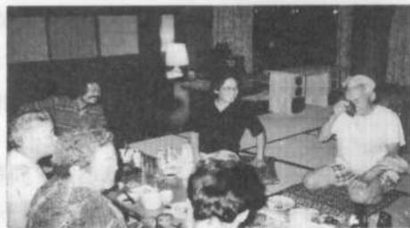
お客様を囲んでの楽しいひととき

しかし、全くのゼロから出発したあぶらむが、わずかの間にここまでやってこれた背景は一体何なのでしょう。ものが全てに優先し、人間が脇に押しやられ、経済的物質的力のみを力とする社会的風潮の中であって、多くの人々の魂がうめき、苦しみの声をあげ、必死になって心の癒しを求めている今日の時代です。そして、元来、人間の魂を養い育てるべき教育までが、経済的発展のみを優先す